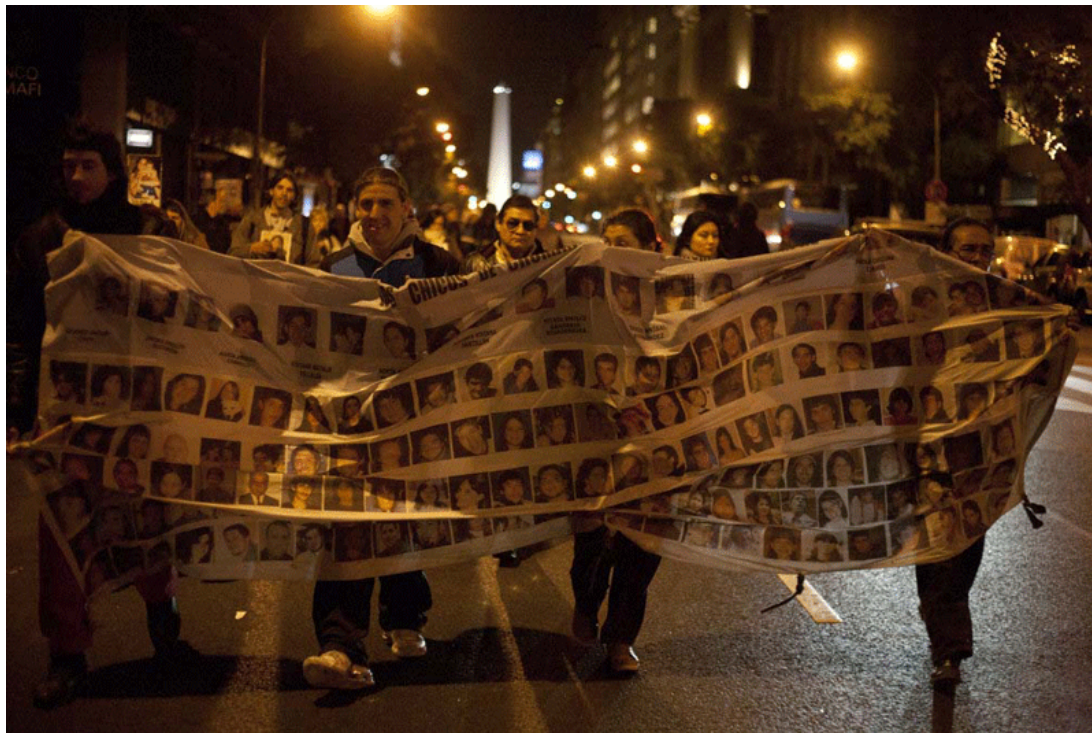
Galería fotográfica: Imagen Insurrecta.- (Ver galería)

Hubo amagos de juicio al director de Cromañón y a una serie de funcionarios de la época, casi todos fueron definitivamente absueltos el 13 de julio de 2012, excepto el director, un comparsa suyo y un cargo policial.]