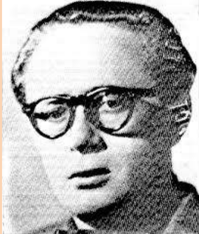
Francisco Ponzán Vidal, "Paco", "el gafotas", "el gurrión" o "el maestro de Huesca"