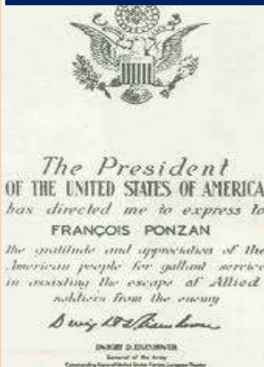
Certificado de gratitud de EEUU. Además fue distinguido por Su Majestad británica con la Hoja de Laurel y la Medalla por la Libertad. Capitán de las fuerzas francesas, Medalla de la Resistencia, Cruz de Guerra y reconocimiento y admiración de los aliados...