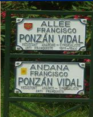
Calles dedicadas a Ponzán en Toulouse.