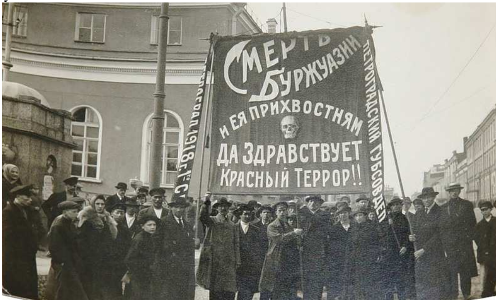
Municipalidad de Petrogrado 1918 "¡Muerte a la burguesía y a sus lacayos!" "¡Viva el terror rojo!"

Desgraciadamente, el texto de 136 páginas (y un glosario de 4 páginas) no se tradujo nunca. Todas las críticas y las denuncias ya eran perogrulladas en la época. Supongo que hoy por hoy se admiten.