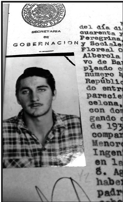
Ficha policial de Octavio Alberola en 1948