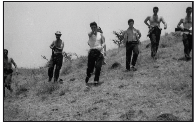
Octavio Alberola (con sombrero) en prácticas de guerrilla en México, a principios de 1959.