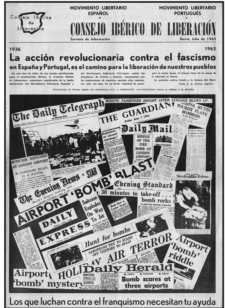
Collage de recortes de prensa de las acciones del DI en 1963 reivindicadas por el CIL, hecho y difundido por la sección de propaganda del DI.