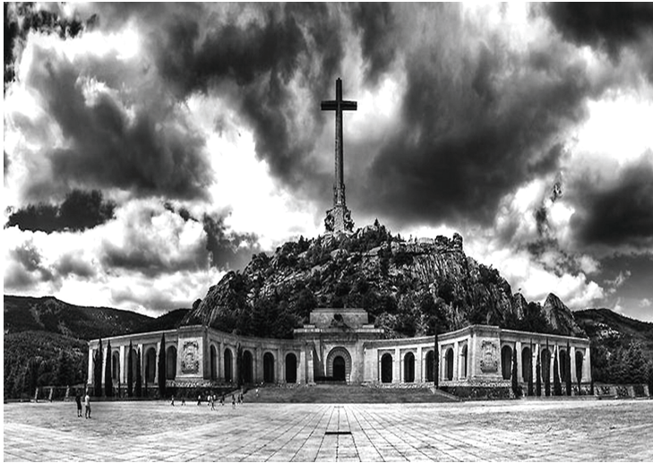
El Valle de los Caídos, futura tumba del general Franco, en donde explotó una bomba poco antes de la que explotó en las cercanías del Palacio de Ayete (abajo), San Sebastián, en agosto de 1962.